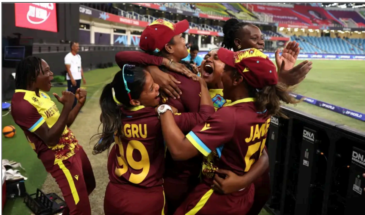
ইংলেণ্ডক হৰুৱাই টি-২০ মহিলা বিশ্বকাপৰ ছেমি ফাইনেলত প্ৰৱেশৰ পিছত কেৰিবিয়ান বাহিনীৰ উল্লাস

বাংগালুৰু, ১৫ অক্টোবৰঃ ভাৰত আৰু নিউজীলেণ্ডৰ মাজত অনুষ্ঠিত হ'বলগীয়া ৩ খন মেচৰ টেবুল শৃংখলাৰ প্ৰথমখন টেবুল কাইলৈ পৰা আৰম্ভ হ'ব। বাংগালুৰুৰ এম চিন্‌স্বামী ষ্টেডিয়ামত হ'বলগীয়া এই খেলখন এতিয়া বৰ্ষা বিঘ্নিত হৈ পৰাৰ সম্ভাৱনাই দেখা দিছে। আজি পুৱাৰে পৰা আৰম্ভ হোৱা প্ৰবল বৰষুণে খেলপথাৰৰ চোৱা-চিতাৰ দায়িত্বত থকা সকলক বিপাণ্ডত পেলাইছে। বৰষুণৰ ফলত টিম ইণ্ডিয়াৰ অনুশীলনো বাতিল কৰিব লগা হয়। বতৰ বিজ্ঞান বিভাগৰ সূত্ৰই জনোৱা আগলি বতৰা অনুযায়ী অহা ৫ দিন ধৰি বাংগালুৰুত ধাৰাসাৰ বৰষুণ হোৱাৰ সম্ভাৱনা আছে। এনে পৰিপ্ৰেক্ষিতত শৃংখলাটোৰ প্ৰথমখনৰ টেবুল লৈ এতিয়া দেখা দিছে অনিশ্চয়তাই।