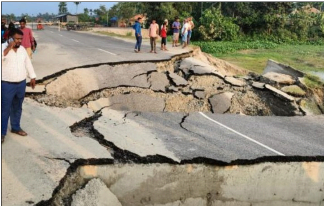
দলগাঁৱত শৰতৰ এজাক বৰষুণতে বিধ্বস্ত অসম মালা আঁচনিৰ অধীনত নিৰ্মাণ কৰা পথ

সংবাদ মাধ্যমত কেইবাবাৰো সম্প্ৰচাৰ হৈছিল। কিন্তু তাৰ পিছতো কোনোধৰণৰ ব্যৱস্থা গ্ৰহণ নকৰিলে বিভাগীয় কৰ্তৃপক্ষই। ধূপগুৰি গাঁৱৰ মাজৰে পাৰ হৈ যোৱা 'অসম মালা' পথত থকা কৰ্নভাৰ্টটো সামান্য এজাক বৰষুণতে বহি যোৱাত বৰ্তমান যোগাযোগ বিচ্ছিন্ন হৈ পৰে শিলবৰী, বৰছলাকে আদি কৰি বৃহত্তৰ এলেকা। কৰ্নভাৰ্টটো বহি যোৱাত ৰাইজৰ মাজত ব্যাপক প্ৰতিক্ৰিয়াৰ সৃষ্টি হৈছে। অনিয়মৰে পথটো নিৰ্মাণ কৰা বাবেই এনে অৱস্থা হ'বলৈ পালে বুলি অভিযোগ কৰিছে ৰাইজে। ঠিকাদাৰ আৰু দায়িত্বত থকা বিভাগীয় বিষয়া-কৰ্মচাৰীৰ বিৰুদ্ধে ব্যৱস্থা গ্ৰহণ কৰাৰ লগতে শীঘ্ৰে পথটো মেৰামতি কৰিবলৈ ৰাইজে দাবী জনাইছে। শূন্য সহনশীলতাৰ কথা কে অহা চৰকাৰখনে এতিয়া ঠিকাদাৰ প্ৰতিষ্ঠান তথা বিভাগীয় বিষয়া-কৰ্মচাৰীৰ বিৰুদ্ধে কি ব্যৱস্থা গ্ৰহণ কৰে সেয়া লক্ষণীয় হ'ব।