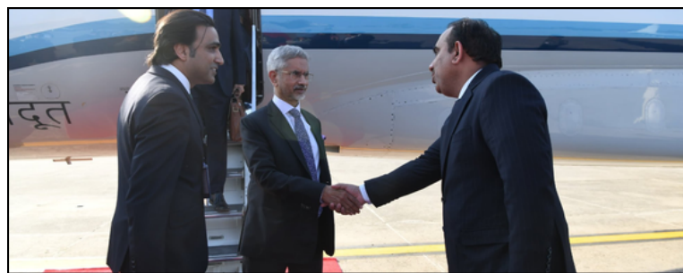
এছচিঅ' পৰিষদৰ বৈঠকত ভাগ ল'বলৈ ইছলামাবাদত উপস্থিত এছ জয়শংকৰ

ই-সংবাদ, ১৫ অক্টোবৰঃ অসমত উপ-নিৰ্বাচন অনুষ্ঠিত হ'বলগীয়া ৫ বিধানসভা সমষ্টিৰ ভোটগ্ৰহণৰ দিন আজি ঘোষণা কৰা হৈছে। ৫টা সম্প্ৰতিক লৈ অসমৰ ৰাজনৈতিক পৰিবেশ গৰম হৈ থকাৰ সময়তে মঙলবাৰে নতুন দিল্লীত অসমৰ ৫ সমষ্টিৰ ভোটগ্ৰহণৰ দিন ঘোষণা কৰা হয়। আজিৰ বিশেষ শেষাংশ ২ পৃষ্ঠাত